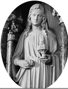
H. Maria Magdalena

In deze moeilijke tijd zullen sommigen onder ons zich ongetwijfeld richten tot hun favoriete 'religieuze helden'. Wij