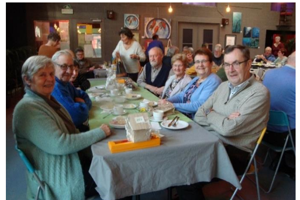
Een gelegenheid om kennis te maken met andere 'OPE supporters'