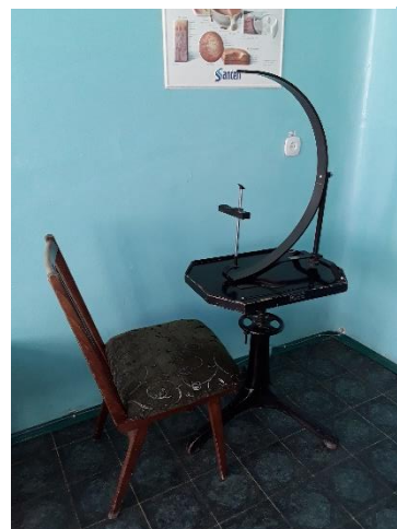
Kabinet van de oogarts