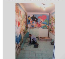
Shower room and toilet

hoop ik dat dit project zich niet alleen zal beperken tot de zeer kwetsbare kinderen, wiens papa in de gevangenis is. Maar dat ook andere kansarme kinderen de kans krijgen om af en toe hun mama te bezoeken. Hiervoor moet er – vermoed ik nog veel gebeuren!