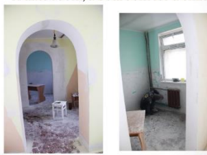
A date room, a bedroom for a child

geschoten, zodat verschillende ruimten binnen de gevangensmuren zijn omgebouwd tot een mooi onthaalcomplex met keukentje, speelruimte, enz. Het is de bedoeling om een gelijkaardig initiatief voor de vrouwengevangenis in de buurt van Ivano-Frankivsk mogelijk te maken. De ervaring heeft me al wel geleerd dat er bij dergelijke projecten zeer veel factoren een rol spelen. Samen met vele anderen