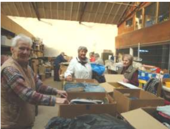
De inpakploeg van woensdagvoormiddag.