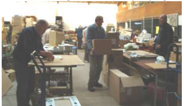
voor de inpak, het stapelen en het laden

Zij zijn onmisbaar! Er wordt hard gewerkt! GRATIS ! Op 3 uren tijd wordt de dubbele grote truck geladen!